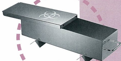
スタンド使用、フタ開

ST-ZEROは、バイオセーフティ キャビネット内で廃棄物を収納して、 そのまま縦型オートクレーブで滅 菌処理できる廃棄物用滅菌缶です。